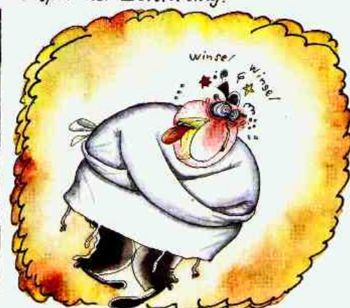
Eine Reise in die Ex-DDR wird ihm schließlich zum Verhängnis.