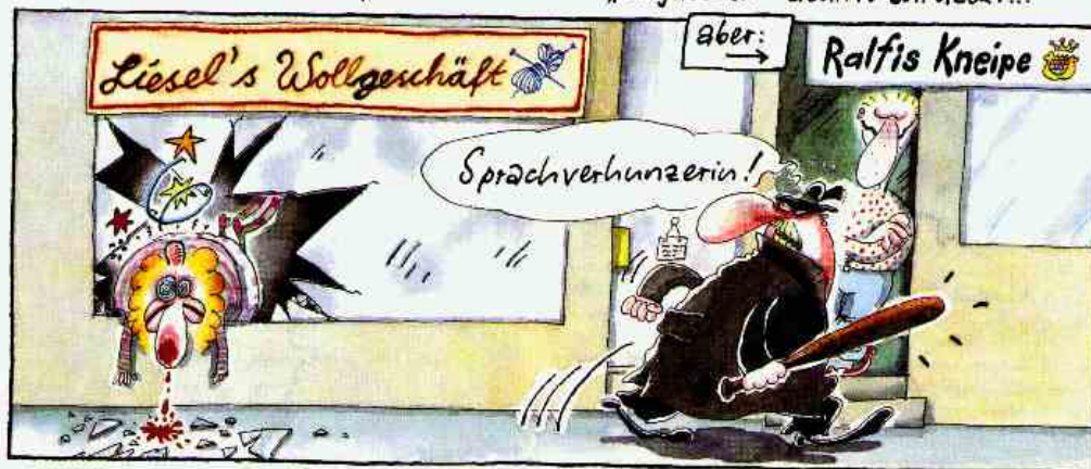
... hinterläßt er eine Spur der Zerstörung!