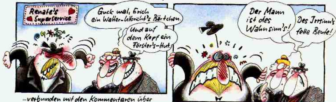
...verbunden mit den Kommentaren über seinen (Walter-Ulbricht-) Spitzbart...