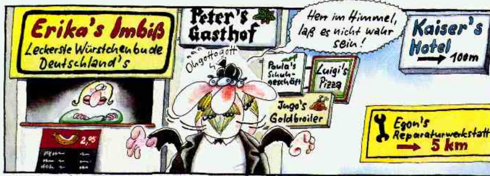
Die konsequente (!), ja absolut vollständige (!!) Negierung der deutschen Genitivs (!!!) in den fünf neuen Bundesländern ...