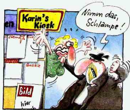
Überall wo er den falschen „englischen“ Genitiv entdeckt...